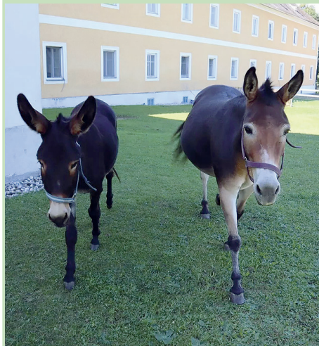
Esel und Maultier auf der Wiese