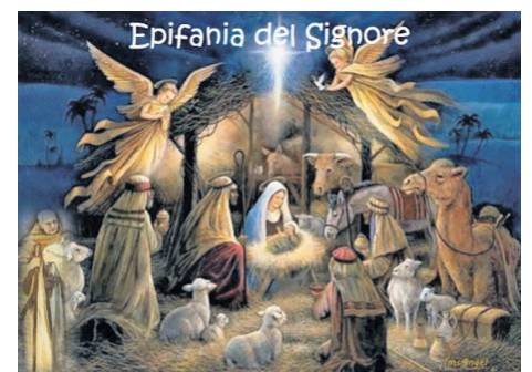
Epifania del Signore