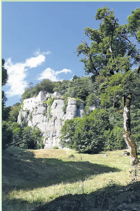
Die Einsiedelei auf dem Berg La Verna