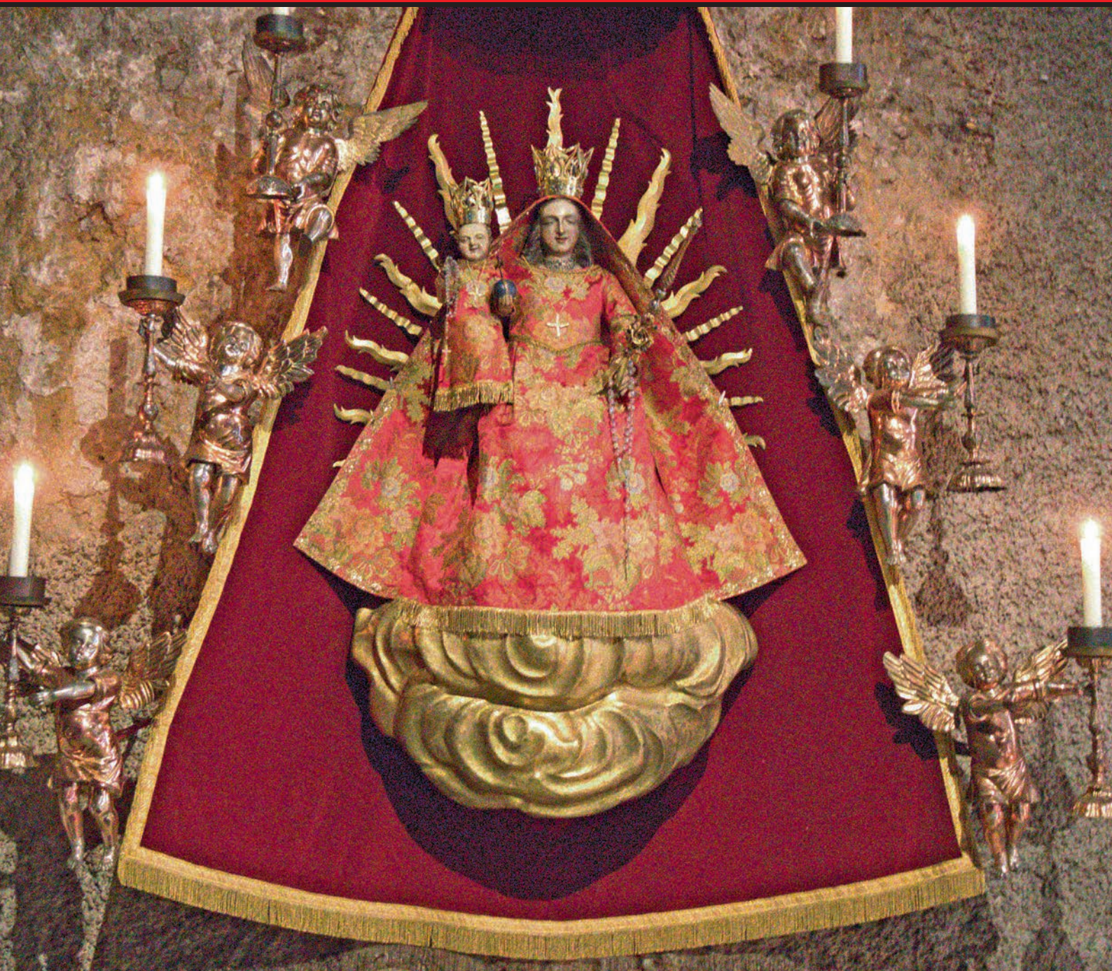
Muttergottes vom Wallfahrtsort Mariastein SO

für die katholischen Pfarreien Oberurnen, Näfels, Netstal, Glarus, Seelsorgeraum Glarus Süd, Franziskanerkloster, Missione