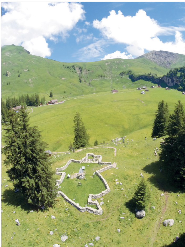
Bild s. 2: Drohnenaufnahme Aelggialp, Mittelpunkt der Schweiz

Titelbild: Das Schweizer Kreuz aus 112 gekochten Eiern und ca. 36kg Tomaten. Es wird am 31.7. abends – 2.8.2021 in der Pfarrkirche St. Hilarius sichtbar sein.