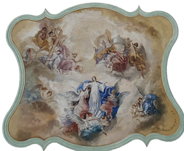
Deckengemälde in der Kirche St. Hilarius Näfels: Verkündigung Mariens (unten), Aufnahme Mariens in den Himmel (oben)