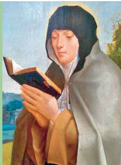
Bild: Hl. Colette nach dem Meister von Lourinhã um 1520 in Lissabon