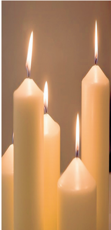
Jesus, das Licht der Welt Fest: Darstellung des Herrn

«Ich bin das Licht der Welt», sagte Jesus von sich selbst und knüpft damit an eine Urfahrung von uns allen.