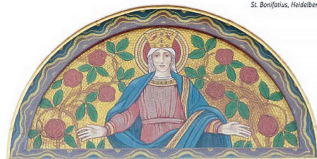
Im Mai feiert die Kirche die Gottesmutter Maria als Maienkönigin. Mitten im Frühling symbolisiert sie das blühende Leben, da sie Jesus das Leben geschenkt hat, durch den Gottes gute Schöpfung von der Vergänglichkeit des Todes erlöst wurde.

Der Monat Mai ist seit alters her der besonderen Verehrung der Gottes Mutter Maria geweiht. Maria hat der Menschheit Jesus, den Sohn Gottes, geboren – unseren Heiland und Erlöser. Wenn Maria verehrt wird, dann verehren wir auch ihren Sohn Jesus.