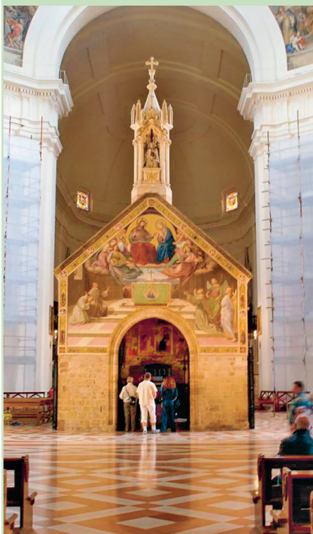
Bild: Portiunkulakapelle in Assisi