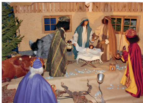
Szene aus der Dreikönigskirche Netstal

Die Heiligen Drei Könige gehören zu den bekanntesten und populärsten Gestalten der christlichen Tradition. Der biblischen Erzäh-