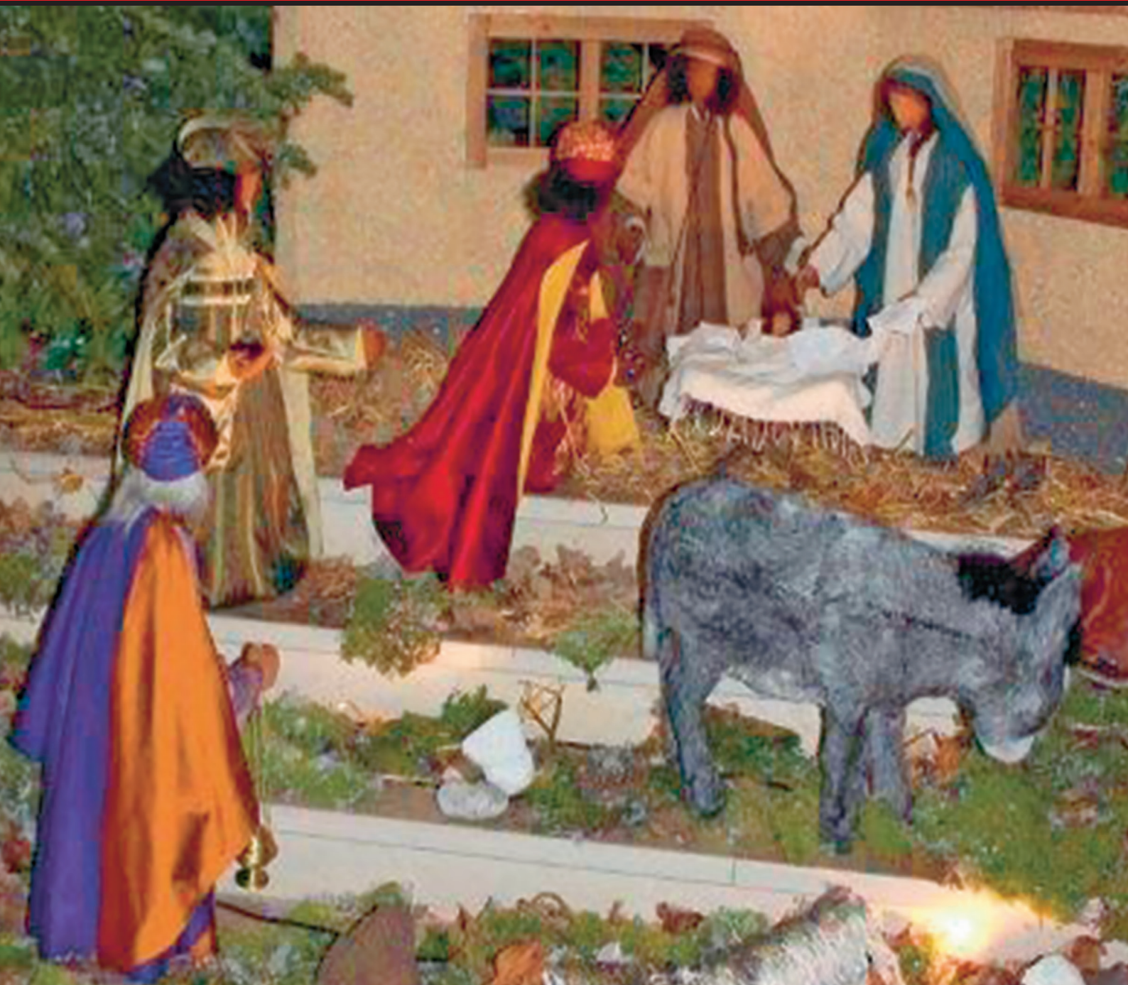
Szene aus der Dreikönigskirche Netstal

für die katholischen Pfarreien Oberurnen, Näfels, Netstal, Glarus, Seelsorgeraum Glarus Süd, Franziskanerkloster, Missionen