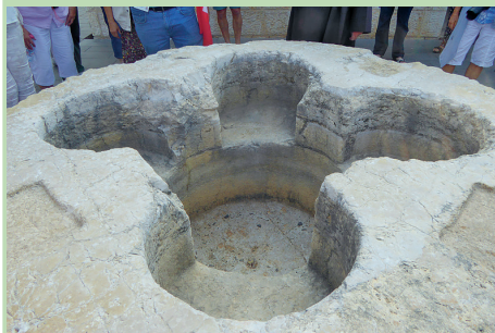
Klassische Taufstelle im Heiligen Land